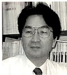
日本臨床検査専門医会